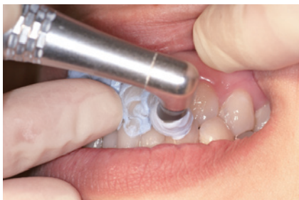
1-10 「プレティオン」を用いて歯面研磨を行う。