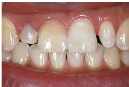
4-2 インターナルブリーチを4回行った。切端側のエナメル質の部分がコンポジットレジンより白くなっているのが確認できる。切端部に関していえば左右でほぼ同じ色調まで回復していると思われる。