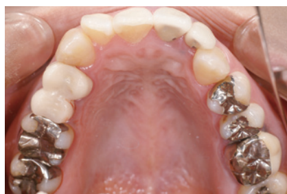
1-2 上顎にはメタルインレーとクラウンが多数装着されており、コンプレックスに感じていたとのこと。⑫には前医にてメタルボンドが装着されている。