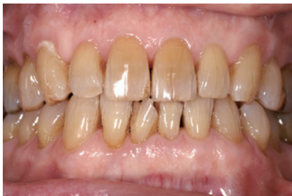
3-1 ホワイトニング前の正面観。たしかに年齢からくると思われる変色やマイクログラックなどが目立つ。色調はB4。

「せっかく白くなったのだから、下の前歯のガタガタも治したい」とおっしゃられ、「グラディアダイレクト」にて 1|1 の修復も行いました。