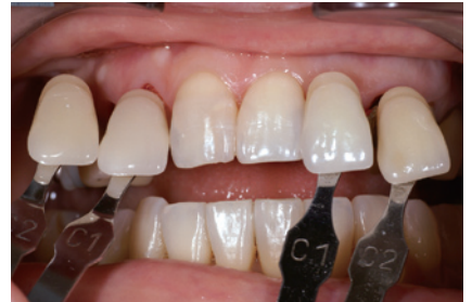
2-3 シェードテイキング。ホワイトニング前のシェード（D2）よりも白い色（C1）を選択することになった。