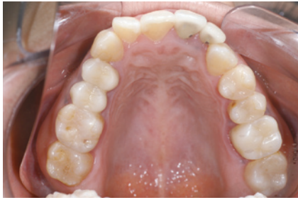
1-4 ハブリッドレジンにてメタルフリー治療を行った。この時点では12のメタルボンドのことは気になっていなかった。