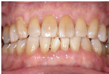
3-2 ホームホワイトニング2週間後の正面観。色調がA3へ改善されるとともにマイクログラックも目立たなくなっている。 1|1 切端の破折が気になる。