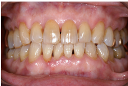
3-4 11 切端を「グラディア ダイレクト」(AO3, CV, GT)で補修した。