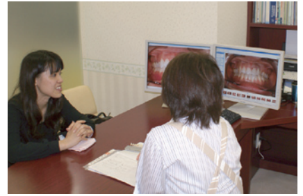
1-6 ホワイトニング前、現時点での口腔内をモニターを見ながらカウンセリングを行った。このときの患者さんと歯科衛生士とのコミュニケーションがとても重要である。