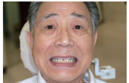
3-3 ご本人もとても満足された様子だった。