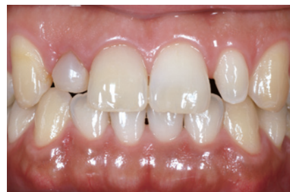
4-3 「グラディア ダイレクト」(AO2, A1, E1)にて歯頸部のコンポジットレジンを詰め替えた。