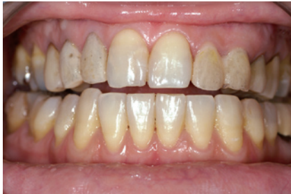
2-1 ホワイトニング前の正面観。 32|23 には「ナノコートカラー」で色調を落としたテンポラリークラウンが装着されている。 1|1 の色調はD2。

合わせてクラウンを作成してはどうか」と提案させていただきました。「ティオン ホーム」を2週間使ってもらった後に、再度シェードテイキングを行い、ハイブリッドレジンクラウンを装着いたしました。