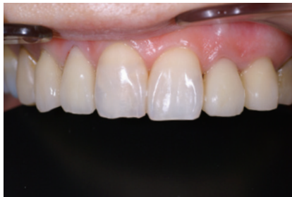
2-5 1|1 のコンポジットレジンの色調が気になるとのことで「グラディア ダイレクト」にて修復治療を行う予定。