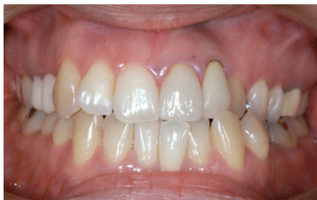
1-11 術前(3; A3.5)と術後(3; B2)。ホームホワイトニング2週間後の正面観。5+5中心に自然な白さになった。逆に12のメタルボンドの暗さが目立ってしまった。