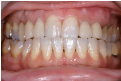
2-4 32|23 にハイブリッドレジン「グラディア フォルテ」を装着。全体的に明るくなり、バランスのとれた口腔内となった。