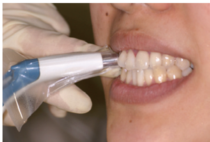
1-8 VITA Easysshadeを用いて術前のシェードを記録する(患者さんが気にしていた3はA3.5)。客観的な資料があると安心である。