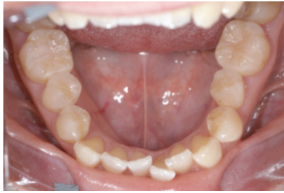
1-5 下顎も同様にハブリッドレジンによるメタルフリー治療を行った。