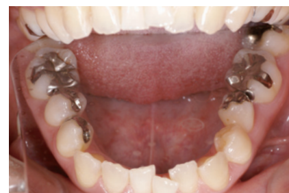
1-3 下顎も同様にメタルインレーが多数装着されている。歯列不正は気にならないとのこと、矯正治療は行わない方針で治療を進める。