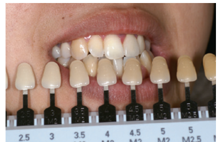
1-9 シェードガイドを用いて患者さん本人にも現時点でのシェードを確認してもらい、カルテに残すとともに患者さんにもメモを渡しておく。多くの患者さんが術前の状態を忘れてしまうらしい。